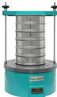
Анализатор A 20 на базе ВП 30Т