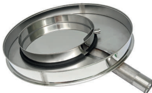
Поддоны Грохота ГР 30 и ГР 50