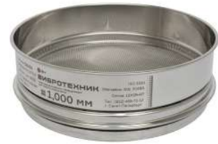
Сито контрольной точности С 20/50К с сеткой из нержавеющей стали