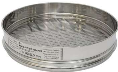
Сито С 30/50 с продолговатыми отверстиями