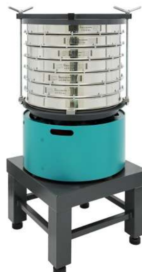
Анализатор A 50 на базе ВП 50 на Тумбе Т 40