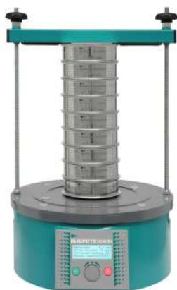
Анализатор A 12 на базе ВПС