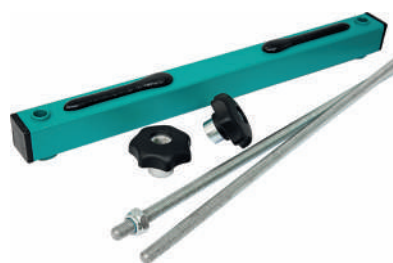
Устройство крепления сит УКС