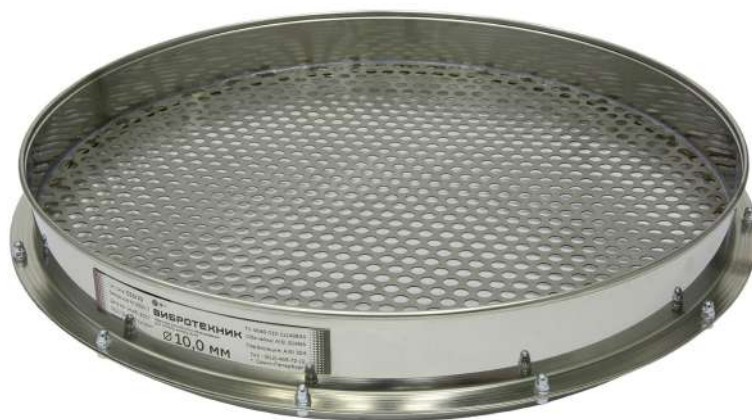
Сито С 50/70 с круглой перфорацией