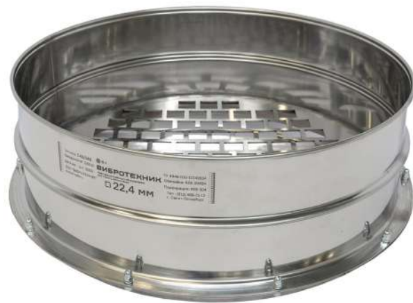
Сито С 40/140 с квадратной перфорацией