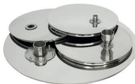
Крышки ГР 30 с мембраной, патрубком и воронкой Крышка ГР 50 с патрубком