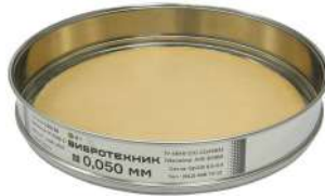
Сито С 20/38 с сеткой из бронзы