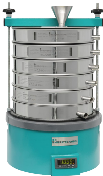
Грохот ГР 30