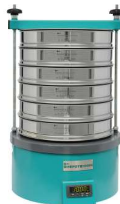
Анализатор A 30 на базе ВП 30Т