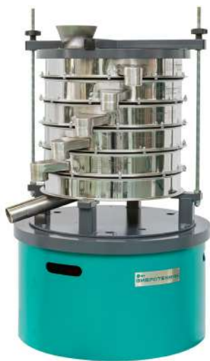
Грохот ГР 40