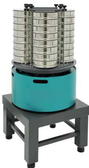
Анализатор A 20x4 на базе ВП 50 на Тумбе Т 40