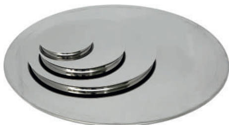
Крышки диаметром 120, 200, 300 и 500 мм