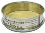
Сито С 12/38 с сеткой из латуни