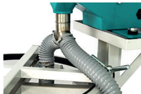
Грохот ГР 50 удвоенной производительности с одновременной загрузкой на 2 сита