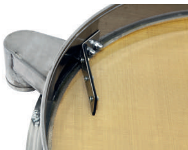
Патрубок и отбойник сита ГР 50