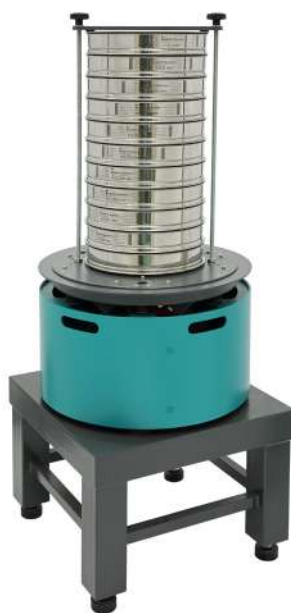
Анализатор A 30 на базе ВП 50 на Тумбе Т 40