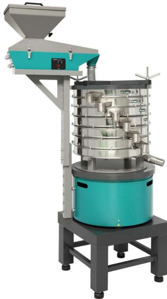
Агрегат рассеивающий на базе ГР 50 с Питателем ПГ 1