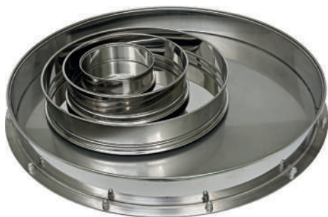
Поддоны диаметром 120, 200, 300 и 500 мм

Поддон грохота предназначен для непрерывной разгрузки в приемную емкость материала, прошедшего через нижнее сито.