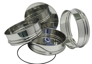
Поддон, промежуточный поддон, крышка, промежуточное кольцо и уплотнительное кольцо

Материал, подлежащий рассеву, загружается на верхние сита, после чего комплекты сит фиксируются на платформе вибропривода с помощью УКС. При включении анализатора в сеть вибропривод сообщает закрепленным на платформе ситам возвратно-поступательные винтовые колебания, что обеспечивает спиралевидную траекторию движения частицы по просеивающей поверхности - от центра к периферии сит. При этом путь, проходимый частицами, значительно превышает диаметр сита, что повышает эффективность отсева. Частота колебаний равна частоте вращения