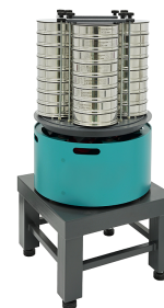
Ситовой анализатор А 12 на тумбе Т 40

Частицы крупностью больше отверстий в просеивающем элементе сита (надрешетный продукт) остаются на сите, а менее крупные (подрешетный продукт) - просыпаются на сита, расположенные ниже. Частицы крупностью менее отверстий нижнего сита просыпаются на поддон.