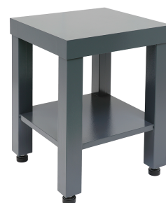
Тумба Т 70

Делитель проб размещается горизонтально на ровной поверхности. Пробосборники устанавливаются под делительный блок до упора. Проба подается в загрузочную воронку. Материал попадает в делительный блок и по желобкам равномерно распределяется по пробосборникам. Части пробы отправляются на дальнейшую обработку или повторное деление.