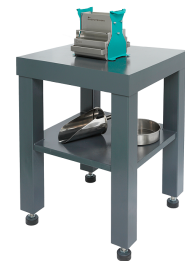
ДП 10 на Тумбе Т 70

Архангельск (8182)63-90-72 Астана (7172)727-132 Астрахань (8512)99-46-04 Барнаул (3852)73-04-60 Белгород (4722)40-23-64 Брянск (4832)59-03-52 Владивосток (423)249-28-31 Волгоград (844)278-03-48 Вологда (8172)26-41-59 Воронеж (473)204-51-73 Екатеринбург (343)384-55-89 Иваново (4932)77-34-06