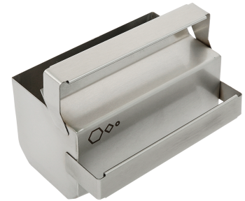
Пробосборник (может использоваться в качестве загрузочного совка)