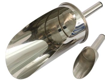
Загрузочные совки объемом 0,07 л. и 1,2 л.